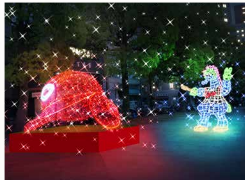
Fエリア/レッДСピリッツ

スライリーオブジェが新登場!! さらに、SNS映えする撮影スポット（カーブビジュアル）や映像投影（30分ごと）など楽しい新企画が目白押しです。