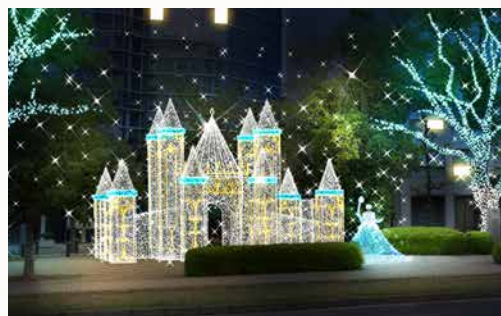
Cエリア/フローズンキャッスル

Area Thema テーマ ドリミネーションの世界にある、水と氷で覆われた美しい国。『水の城』からは絶えずまばゆい光りが溢れ出し、人々に安らぎと癒しをもたらす。