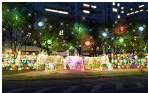
Lエリア/ミュージックガーデン

Area Thema テーマ ドリミネーションの世界にある、一年中、花が満開に咲くほどの穏やかな気候が続く国。広大な花畑から聞こえてくる美しい音色は、人々を陽気な気分にする。