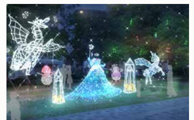
ドリミフェスティバル サウスサイド2