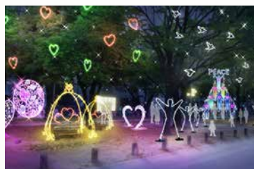
ドリミフェスティバル ノースサイド2

ドリミネーションの世界で30年に1度、開催されるお祭り「ドリミフェスティバル」。このときばかりは、いろいろな国の住民たちが集まって大笑い。楽しい時間をあなたもどうぞ!