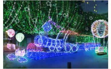
ドリミフォレスト サウスサイド