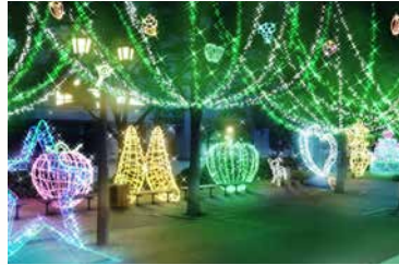
ドリミフォレスト ノースサイド

太陽の国と水の国を結ぶ大きくて深い森。大人達が知らない子供達の秘密の遊び場になっている。どうやら、大人になると、この森のことは忘れてしまうらしい…。