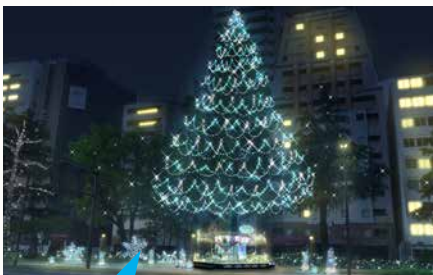
スノーウィーツリー