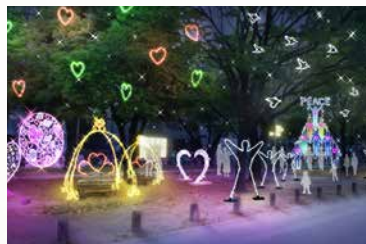
ドリミフェスティバル ノースサイド2

ドリミネーションの世界で30年に1度、開催されるお祭り「ドリミフェスティバル」。このときばかりは、いろいろな国の住民たちが集まって大笑い。楽しい時間をあなたもどうぞ!