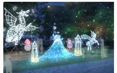
ドリミフェスティバル サウスサイド2