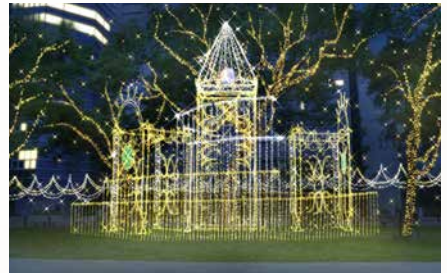
キャッスル オフ ザ サン～太陽の城～

ドリミネーションの世界にある、一年中、花が満開に咲くほどの穏やかな気候が続く国。「太陽の城」から注がれる光りがすべてのモノに命を吹き込む。