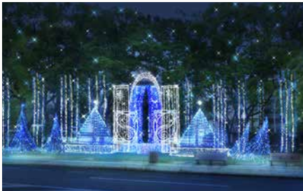
アクアパレス～水の宮殿～

ドリミネーションの世界にある、水と氷で覆われた美しい国。「水の宮殿」から絶えず溢れ出る水は、人々に安らぎと癒しをもたらす。